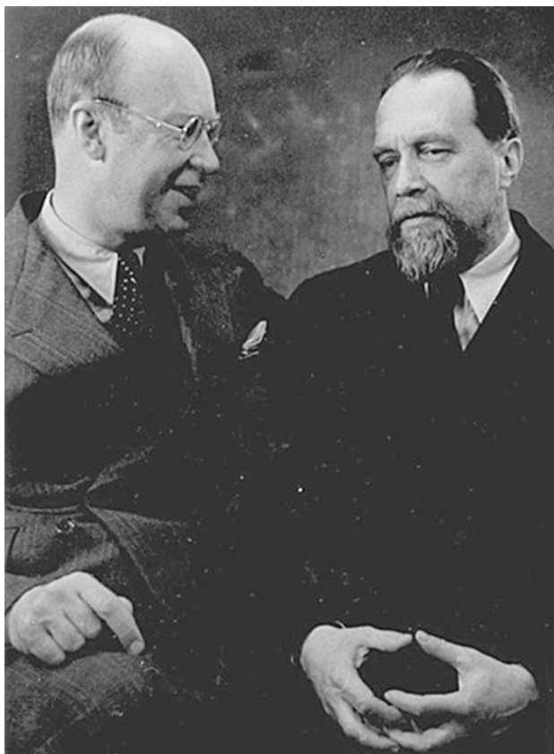
С. Прокофьев и Н. Мясковский